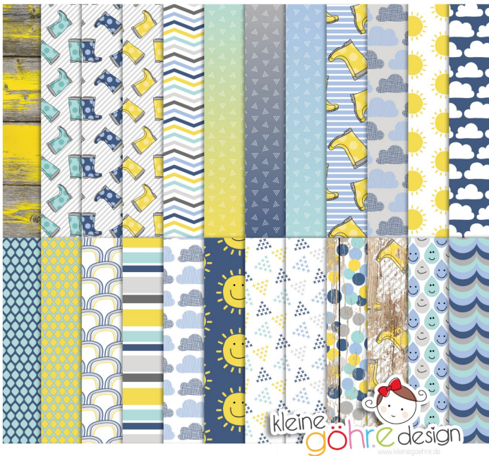
digitale Papiere "Tanz im Regen Muster&Co"