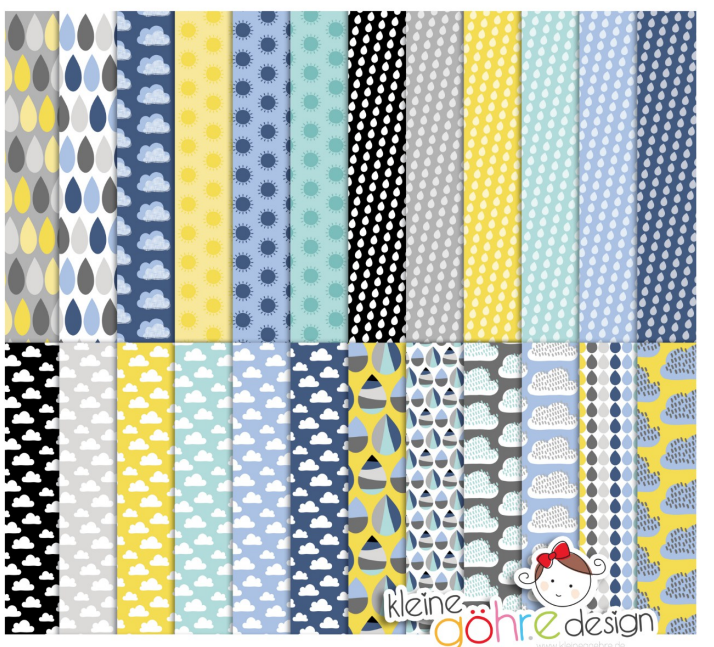
digitale Papiere "Tanz im Regen Tropfen&Co"